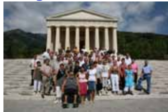
Possagno: davanti il tempio di Canova, dopo visita al museo