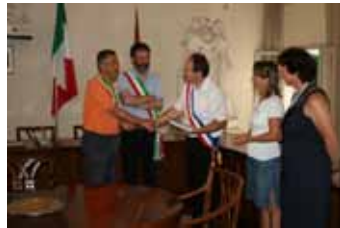
Incontro dei "nostri" sindaci con il primo cittadino di Possagno