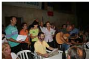
I canti degli italiani