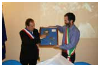
Pascal offre un quadro che rappresenta il legame consolidato