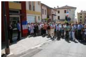
Tutti davanti la sala polifunzionale "La Chapelle sur Loire"