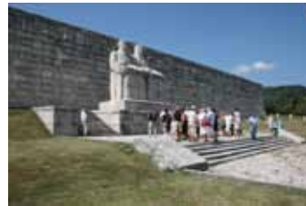
Pederobba: omaggio ai caduti francesi della Grande Guerra