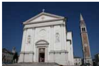
Visita al duomo di Crespano