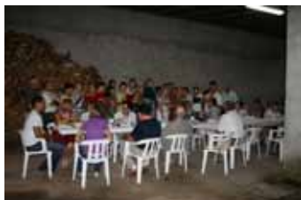
I canti dei francesi