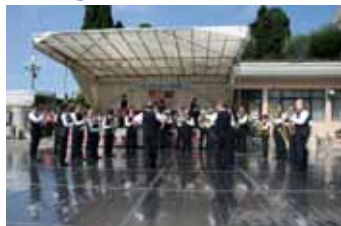
Dopo la processione, la banda