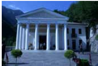
Dopo il pranzo in agriturismo, visita alla Madonna del Covolo