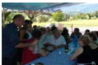
Pranzo in famiglia