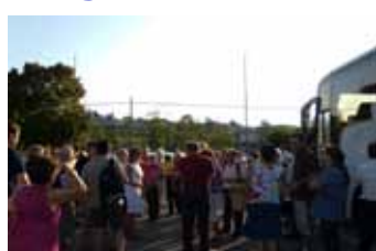
Pronti per l'arrivederci