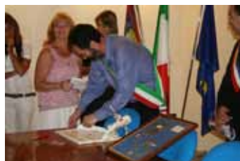
Regalo per il sindaco da parte della presidente del gemellaggio