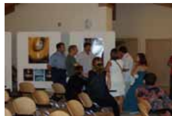
Visita alla mostra fotografica delle Terre Rosse