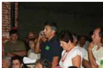
E che canti!