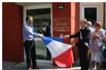
Ecco la targa