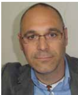
Giancarlo Tollero Vicecapogruppo maggioranza