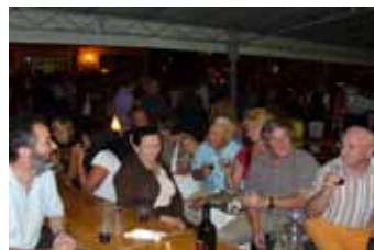
La sera ritrovo libero alla sagra di San Bortolo