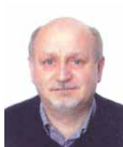
Arfeo Canaglia Assessore Agricoltura, Commercio, Artigianato, Industria, Turismo, Mercati