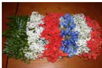
Cuscino floreale dedicato all'amicizia italo-francese