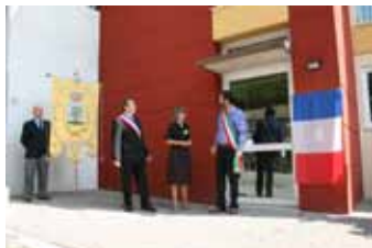
La cerimonia di intitolazione