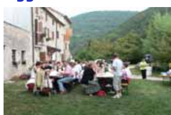
... ma poi si mangia tranquilli