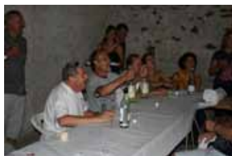
Il nostro vice-presidente alle prese con il limoncello e "o-le-lè o-la-là..."