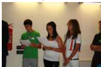
All'interno della sala anche gli studenti dell'I.C. di Fara