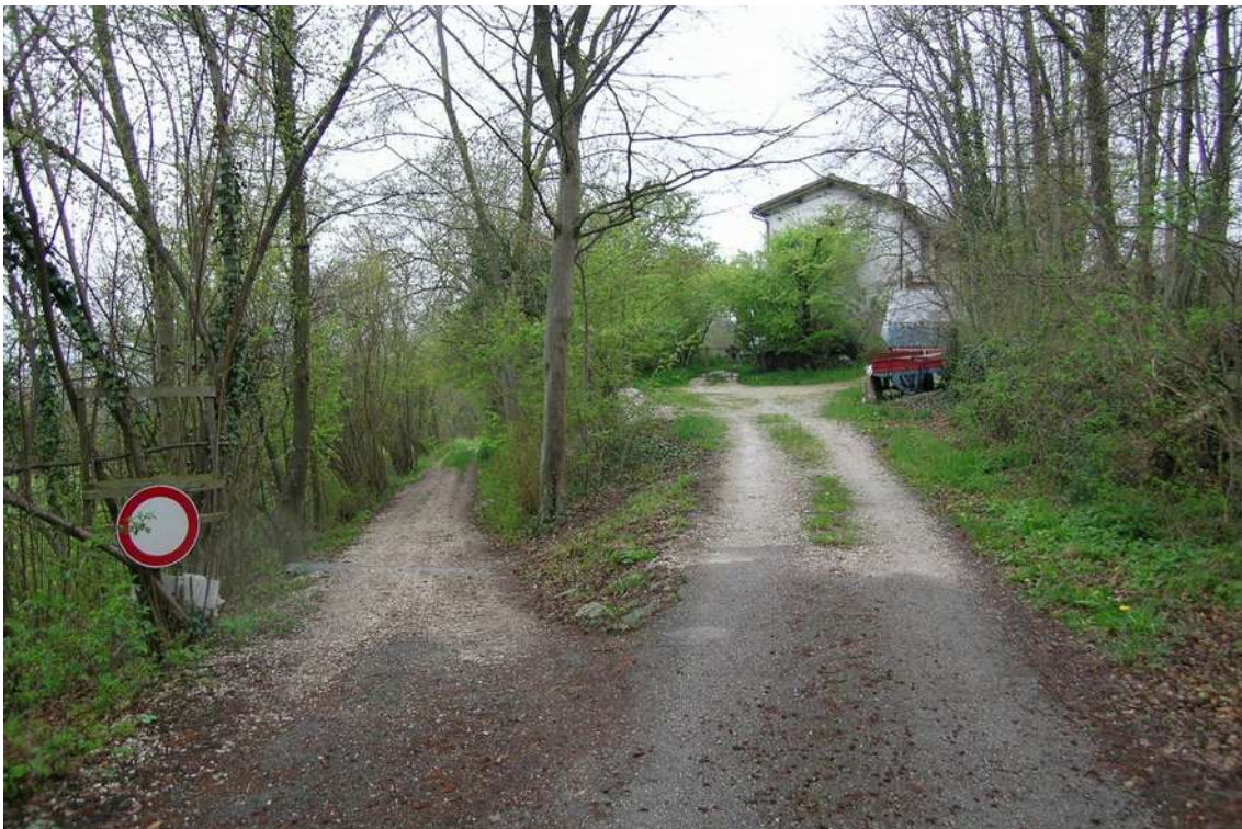
Il relitto stradale (sulla destra), nel tratto in cui serve come accesso al mappale 190