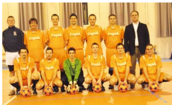
Cazzano United Campionato CSI serie B 2010/11