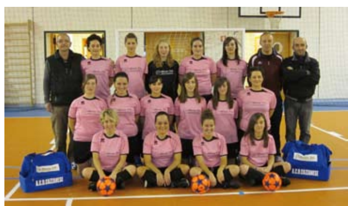
Cazzanese Femminile Campionato Circolo Noi 2010/11