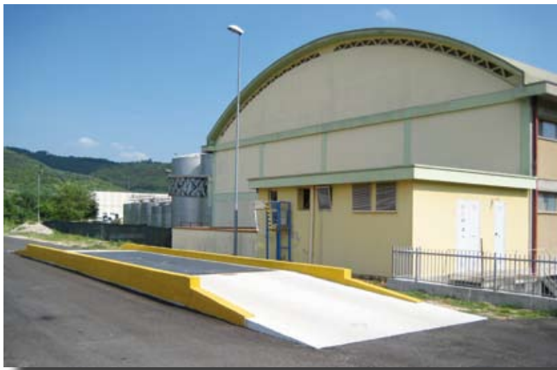
Pesa pubblica in Z.A.I.