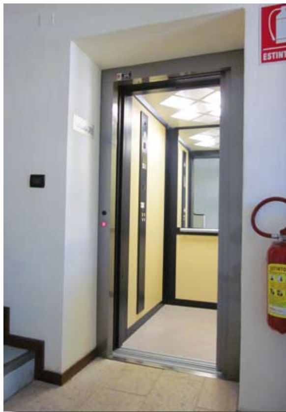
Ascensore in Municipio