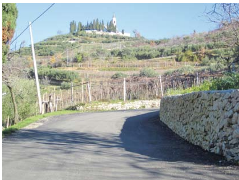
Strada per Campiano