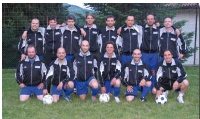
Cazzanese 1^ Class. Campionato UISP 2007/08