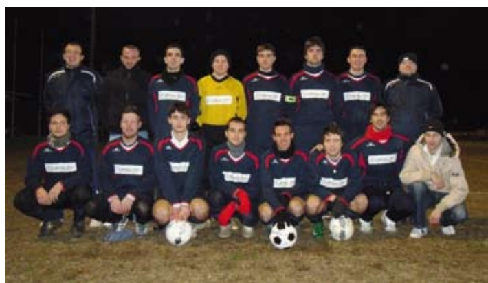
Cazzanese Junior camp. UISP 2010/11