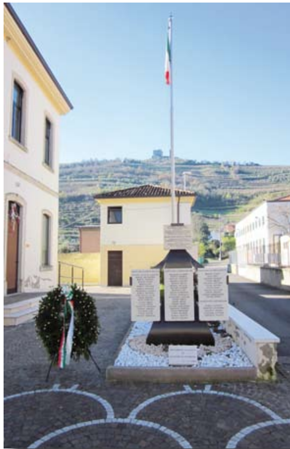
Monumento ai Caduti