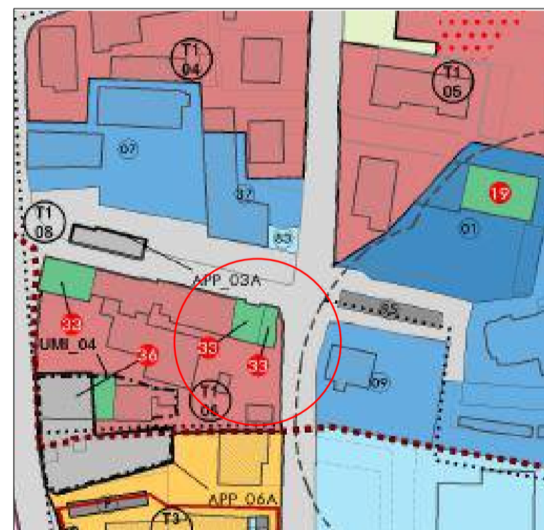
Estratto Piano Interventi stato attuale