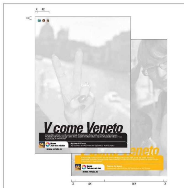
Esempio di applicazione logo turismo (dal Manuale d'uso del marchio turismo Veneto)

In questi casi, l'applicazione dei loghi e delle didascalie previste dal PSR Veneto si integra con le linee guida previste dalla Regione del Veneto per gli interventi a scopo turistico finanziati attraverso i fondi europei.