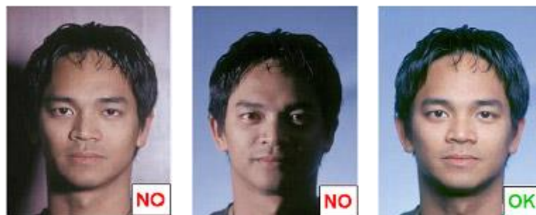
Ombra sullo sfondo