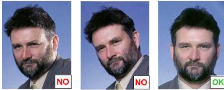
Posizione angolata da ritratto in studio