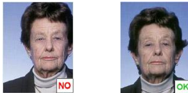
Testa non centrata

Non ci devono essere ombre ne' sullo sfondo (Fig.7) che deve essere uniformemente illuminato