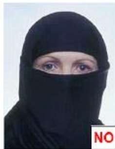
figura 12 bis