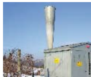
Un cannone ad onda d'urto

Per questo progetto ci siamo già espressi favorevolmente ed a bilancio sono disponibili i fondi per aderirvi.