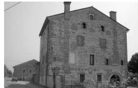
Fianco occidentale (E.U.) Fronte settentrionale (E.U.)

Da un esame della planimetria e dei muri interni, risalenti a epoche diverse, si potrebbe pensare che la fabbrica sia sorta attorno a un nucleo molto antico, forse una torre della fine del xiv secolo. Questa seconda fase di costruzione, collocabile alla metà del Quattrocento, presenta i caratteri tipici della residenza rurale ispirata ai moduli del gotico veneziano (Cevese 1971).