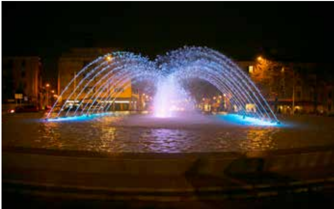
Esempio illuminazione fontana

Dopo essere rimasta "a secco" per oltre dieci anni, la storica fontana di piazza Massalongo finalmente tornerà a riempirsi d'acqua per volere dell'amministrazione comunale di Tregnago. Questa volta, però, non si tratterà di quel liquido sporco e stagnante che periodicamente si accumula sul fondo della vasca, ma di acqua molto più pulita che verrà messa in circolo da un sistema di pompa filtrante che dovrà contribuire a renderla tale anche in futuro.