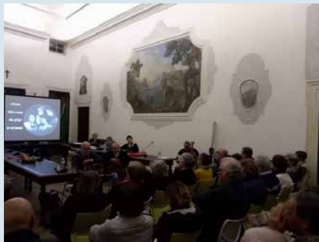
Inaugurazione lezioni nella sala consiliare del municipio - 13 ottobre 2018

È iniziato in ottobre il terzo anno accademico dell'Università del Tempo Libero, iniziativa organizzata dall'assessorato alla cultura, dalla biblioteca comunale, dall'associazione culturale Arte & Parte e dal gruppo CIF. Anche quest'anno gli incontri, che stanno avendo una buona partecipazione, si svolgono presso la sede del Circolo Anziani in vicolo Carlo Cipolla ogni mercoledì dalle 15.30 alle 17. Le tematiche trattate sono varie: ogni settimana un argomento diverso.